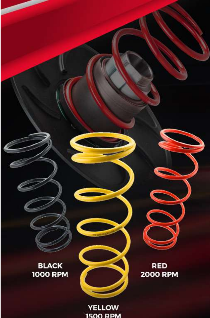
BLACK 1000 RPM

TDR SUPER CVT PULLEY ASSY + ROLLER CVT SET + CVT SPRING ALL NEW PCX 160 CC (HP: 15.9 - TORQUE: 10.9) STANDARD (HP: 15.8 - TORQUE: 10.7)